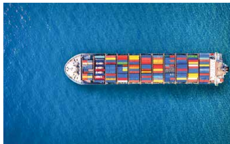
Η ελληνική ναυτιλία δεν είναι απλώς ένας οικονομικός κλάδος. Είναι πυλώνας σταθερότητας σε έναν ασταθή κόσμο.