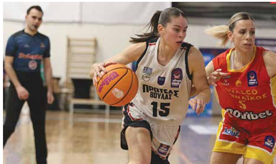
Στιγμιότυπο από την ιστορική παρουσία του Πρωτέα στον τελικό

Τα έδωσαν όλα στο παρκέ και κατέκτησαν τη δεύτερη θέση στο Κύπελλο Ελλάδας