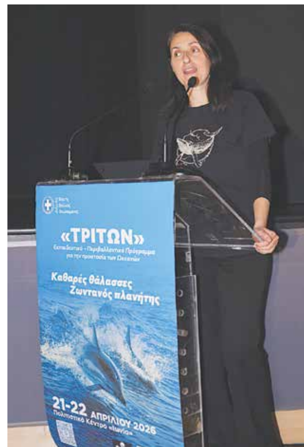
και ενεργοποίησης των πολιτών για την προστασία του θαλάσσιου περιβάλλοντος.

Το πρόγραμμα είχε ως στόχο την ανάπτυξη περιβαλλοντικής συνείδησης, την προώθηση βιώσιμων καθημερινών συνηθειών και την ενίσχυση της συνεργασίας και της δημιουργικότητας των μαθητών. Αποτελεί, όπως δηλώνουν τα στελέχη της διοίκησης, το πρώτο βήμα της ευρύτερης καμπάνιας ενημέρωσης και περιβαλλοντικής ευαισθητοποίησης που υλοποιεί ο Δήμος Βάρης Βουλιαγμένης στο πλαίσιο του «έτους των ωκεανών». Η καμπάνια αυτή θα κορυφωθεί με τη διοργάνωση του 3ου φεστιβάλ Mare Nostrum – Ποσειδωνία, το οποίο θα πραγματοποιηθεί στις 23 και 24 Μαΐου 2026 στη Βάρκιζα, συνεχίζοντας την προσπάθεια ενημέρωσης