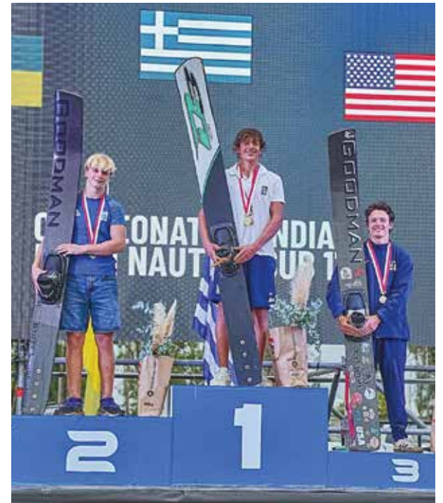
Ο αθλητής στο βάθρο του Παγκοσμίου Πρωταθλήματος U17 στην Κόρδοβα της Αργεντινής

Η σπουδαία αυτή επιτυχία αποτελεί ακόμη έναν κρίκο