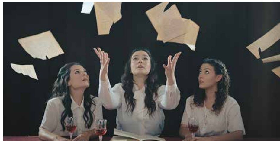
Το Σάββατο 4 Απριλίου στην αίθουσα Ιωνία της Βούλας θα ανεβεί το υποβλητικό μιούζικαλ «Οι ανέγγιχτες» μια δημιουργία των Αντώνη Χανιώτη και Λάμπρου Κομζιά

Το ίδιο βράδυ, στις 8 μ.μ., το Δημοτικό Θέατρο Βάρης (στην οδό Άττιδος) φιλοξενεί την παιδική παράσταση «Το αγόρι με τα μπλε μαλλιά». Ο ήρωας της ιστορίας, ο Άτρο,