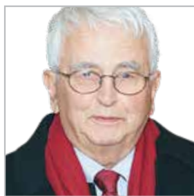
Γράφει ο Βύρων Τομάζος