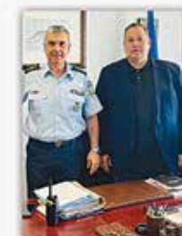
Με τον Αστυνομικό Διευθυντή Νοτιοανατολικής Αττικής Ταξίαρχο κ. Άγγελο Παπαγγέλη

Η ασφάλεια και η προστασία, αποτελούν Ζητήματα και απαίτηση της κοινωνίας.