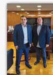
Με τον Υφυπουργό Προστασίας του Πολίτη κ. Κώστα Κατσαφάδο

Στα πλαίσια των αρμοδιοτήτων και των υποχρεώσεών μου, ως Ειδικός Σύμβουλος Δημάρχου σε θέματα Ασφαλείας , μετά από σχετική οδηγία του, επισκέφτηκα διαδοχικά τον Υφυπουργό Προστασίας του Πολίτη, κύριο Κώστα Κατσαφάδο και τον Αστυνομικό Διευθυντή Νοτιοανατολικής Αττικής, Ταξίαρχο κ. Άγγελο Παπαγγέλη, προκειμένου να συζητήσουμε επίκαιρα ζητήματα ασφάλειας των πολιτών στο Δήμο Βούλας-Βάρης- Βουλιαγμένης.