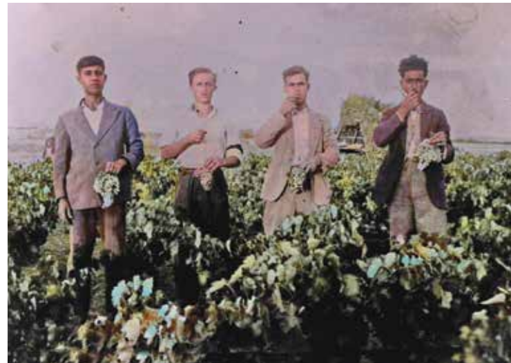
Αμπέλια στο σημείο όπου σήμερα διασταυρώνεται η παραλιακή με τη λεωφόρο Βουλιαγμένης, τη δεκαετία του 1930

Μέσα σε λίγους μήνες κάποιοι πρόσφυγες έχτισαν με δικά τους χρήματα λίγα πλινθό-