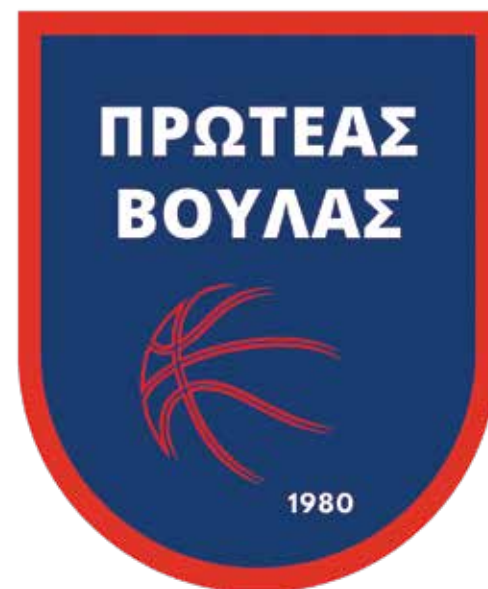
Το λογότυπο του Πρωτέα ανασχεδιάστηκε, στα ίδια χρώματα αλλά με μίνιμαλ αισθητική και πιο καθαρές γραμμές

Ο Στέργιος Γεωργακόπουλος ορίζει ως εξής του στόχους της νέας χρονιάς: «Να αγαπήσουν τα παιδιά το μπάσκετ και τον αθλητισμό σε ένα υγιές και προστατευμένο περιβάλλον. Να βελτιώσουν τις μπασκετικές τους δεξιότητες, να περάσουν ομαλά από το παιχνίδι στον αγώνα και να αποκτήσουν συνήθειες που θα τους ακολουθούν σε όλη τους τη ζωή. Να δημιουργήσουμε ομάδες υψηλού αγωνιστικού επιπέδου που θα πρωταγωνιστούν και παίκτες που θα μπορούν να αγωνίζονται με αξιώσεις σε επίπεδο εθνικών ομάδων και στις γυναικείες και ανδρικές μας ομάδες. Να δώσουμε την ευκαιρία σε κάθε αθλητή ξεχωριστά να εξελιχθεί στο μέγιστο των δυνατοτήτων του. Με το μόντο "Μία ομάδα, μία οικογένεια" να ενδυναμώσουμε τις σχέσεις μεταξύ των μελών μας στη μεγαλύτερη αθλητική κοινότητα της Αττικής».