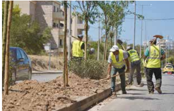
Στην οδό Καλύμνου τοποθετήθηκαν 255 μικροδάφνες ύψους 3 μέτρων

Πρόσφατα ολοκληρώθηκε η δεντροφύτευση σε όλο το μήκος του διαζώματος της λεωφόρου Καλύμνου, μια παρέμβαση που μετέτρεψε τον πολυσύχναστο αυτόν δρόμο σε μια πράσινη διαδρομή. Ο Δήμος φύτευσε 255 μικροδάφνες ύψους τριών μέτρων, ενώ παράλληλα τοποθετήθηκε αυτόματο σύστημα άρδευσης. Επιπλέον, ολοκληρώθηκε και η πράσινη ανάπλαση στο παραλιακό μέτωπο της Βάρκιζας στο σημείο «Κανάρια». Οι φυτεύσεις αποτελούνται από είδη που χαρακτηρίζουν τη μεσογειακή χλωρίδα ή είναι απόλυτα προσαρμοσμένα στις τοπικές συνθήκες, ώστε να μη διαταραχθούν τα τοπικά οικοσυστήματα, αλλά και να εξασφαλιστεί η ταχεία, υγιής και εύρωστη ανάπτυξη τους. Ένας ακόμα δρόμος που θα μεταμορφωθεί είναι αυτός της Βασιλέως Κωνσταντίνου στη Βάρη. Η παρέμβαση εκεί, θα περιλαμ-